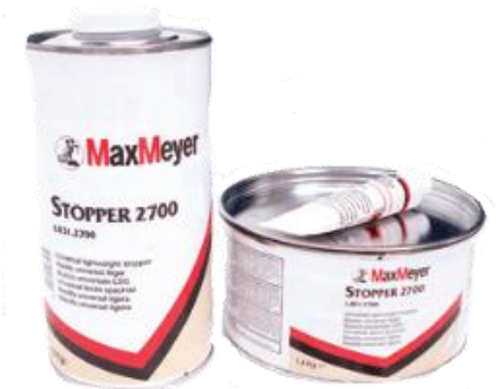
1.831.2700 Masilla Universal Ligera