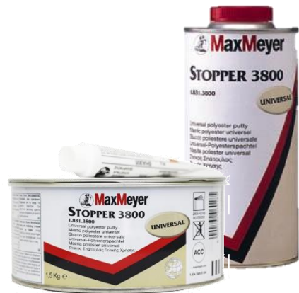
1.831.3800 Masilla 3800