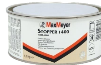
1.831.1400 Masilla para plásticos